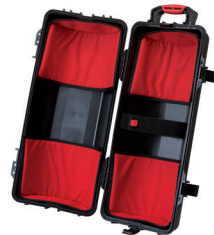
* tri version