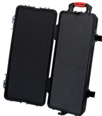
* cubed foam