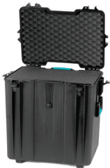
* cubed foam