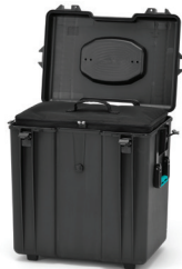
* interior bag