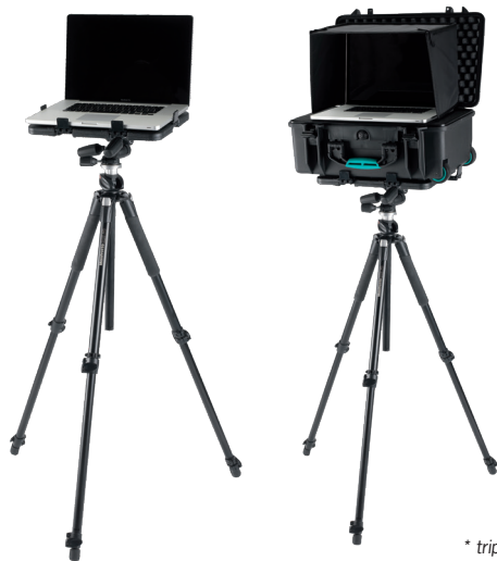
* tripod, laptop and schelter not included