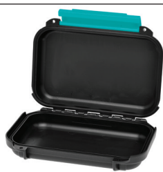
* cubed foam