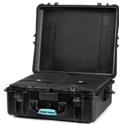
* interior bag