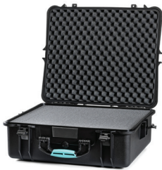
* cubed foam