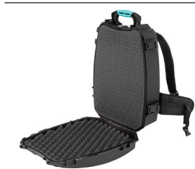
* cubed foam