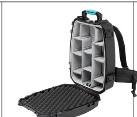
* second skin