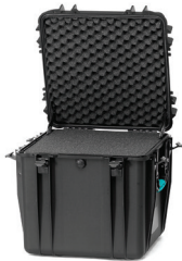
* cubed foam